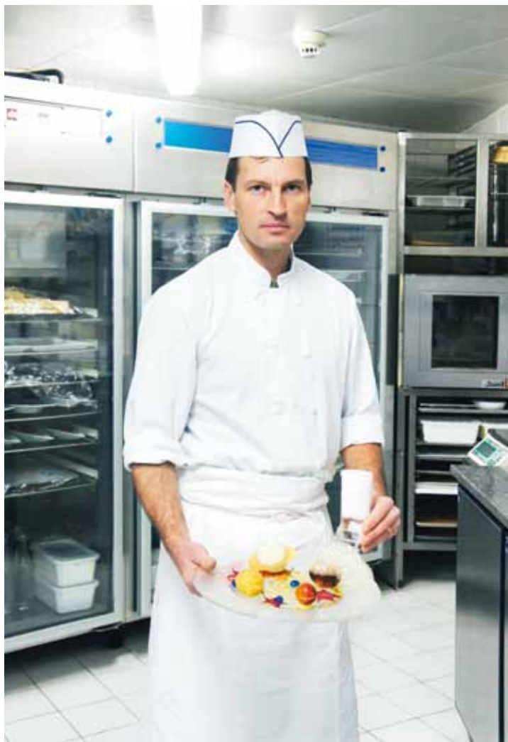
Savoirs, savoir-faire, savoir-être, trois ingrédients de la compétence.

La GPEC a pour ambition de voir à moyen terme. Un an, deux ans, trois ans, voire plus, selon le contexte et le type d'entreprise. Il s'agit d'une gestion anticipative et préventive. Elle s'appuie sur une analyse de la situation actuelle et de celle des événements à venir : les contrats aidés sont amenés à disparaître, quelles nouvelles solutions d'embauche pour les structures qui y font appel ? Une personne clé de l'équipe va partir à la retraite dans un an, comment la remplacer ? Le numérique arrive à grand pas, comment reconverter les techniciens ? C'est une démarche vivante, qui est amenée à évoluer au fil des mois. Même si elle implique un plan d'action initial (lire pages 14-15), fixant des objectifs – lorsque la démarche est officiellement mise en place –, sa raison d'être est de coller aux besoins de l'entreprise et donc d'évoluer avec eux.