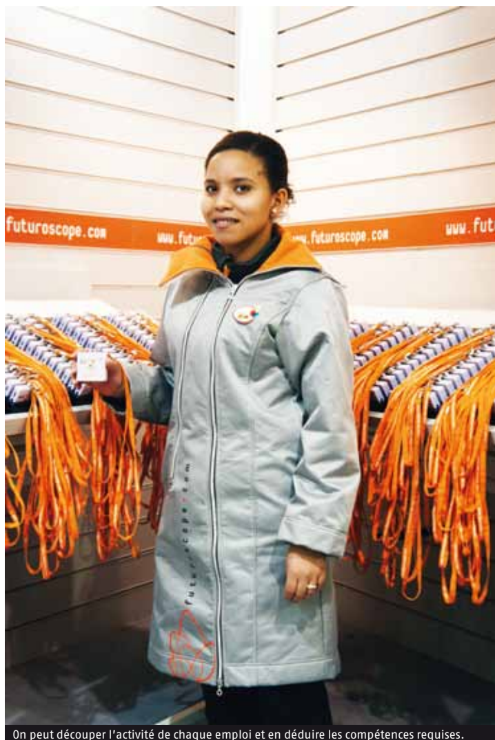
On peut découper l'activité de chaque emploi et en déduire les compétences requises.

Obligation de la mise en place d'une négociation GPEC triennale pour les entreprises de + de 300 salariés.