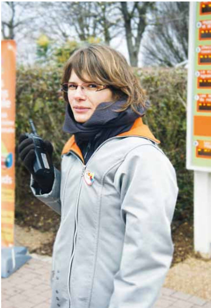
Les questions liées à l'emploi et aux compétences sont toutes examinées.

➌ Sensibilisation à la gestion des emplois et des compétences (le cœur du sujet, les questions deviennent plus précises) : quelle est l'ancienneté moyenne ? Quelle est la pyramide des âges ? Quels