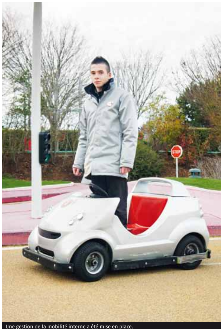
Une gestion de la mobilité interne a été mise en place.

mances ? « Nous avons utilisé la formation comme un outil pour enrichir le rôle des managers ». Une gestion de la mobilité interne a été organisée. Autres outils élaborés, un répertoire des métiers et des emplois ainsi que des référentiels de compétences par emploi, avec des exigences clés par poste et des bonnes pratiques en guise de repères. « Ces référentiels sont utilisés lors des recrutements, des entretiens d'évaluation et de formation ». Chaque début d'année, les ma-