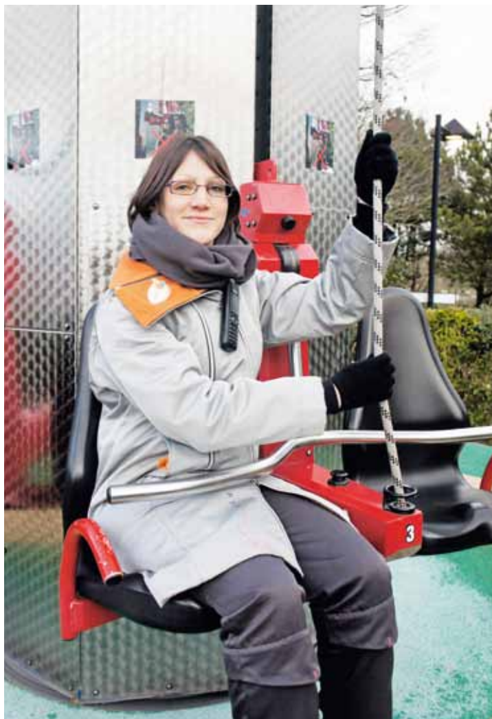
Objectif : faire du Futuroscope une entreprise dans laquelle on puisse rebondir.

La question de l'employabilité est apparue dans les années 2000, alors que le parc connaissait une baisse de la fréquentation. Moins d'attractivité, un projet de vente, des difficultés de recrutement... « La direction a alors décrété que si le Futuroscope ne pouvait plus créer des emplois à vie comme c'était le cas au début, alors il fallait qu'il devienne une entreprise dans laquelle on puisse rebondir ». En gardant l'objectif premier du parc – dynamiser l'emploi dans le département – et désormais offrir aux jeunes Viennois des expériences professionnelles valorisables ailleurs. « Nous voulons que l'expérience acquise ici favorise l'emploi à l'extérieur et que "vacataire" et "saisonnier" ne soient pas synonymes de précarité mais de passerelles vers d'autres emplois. Les personnes déve-